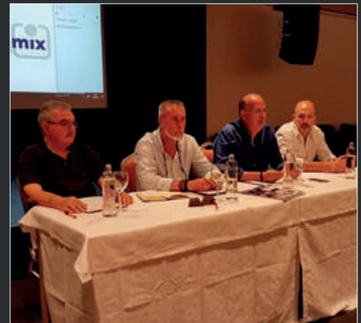
La Asociación de Baleares se reúnen en su sesión asamblearia.