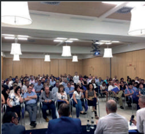
Nuestros compañeros de Valencia celebran su Asamblea General.

“FENAMIX, invitada a la feria Expojoc 2017”