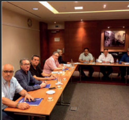
Junta Directiva de FENAMIX