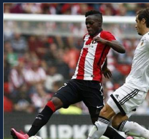
Iñaki Williams gana el trofeo 'Apuesta del Año' de Loterías y AEPD como jugador revelación de 2016-17