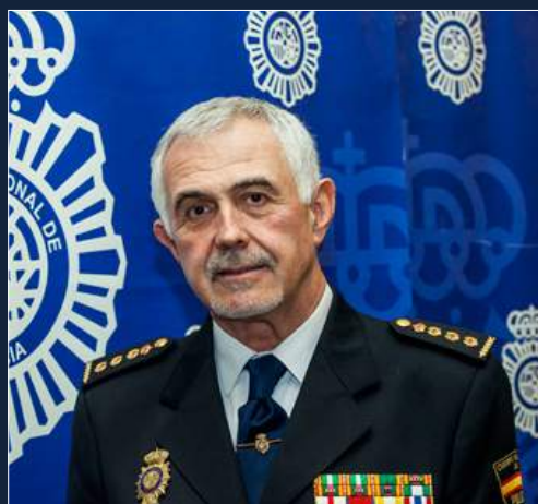
El Centro Nacional Policial de Integridad en el Deporte y Apuestas es una realidad que pronto se presentará en sociedad.