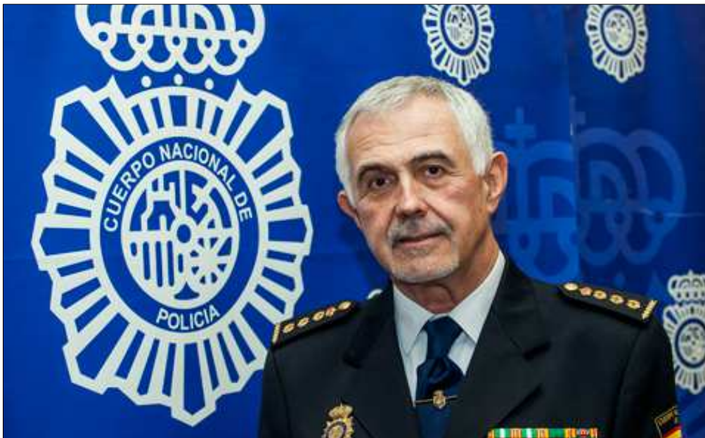
Héctor Moreno, Comisario Jefe de la Unidad Central de Delincuencia Especializada y Violencia

EL CUERPO NACIONAL DE POLICIA LLEVA UN AÑO PREPARÁNDOSE PARA COMBATIR EL FRAUDE EN EL DEPORTE FORMANDO PERSONAL ESPECIALIZADO Y CREANDO LAS BASES DE COOPERACIÓN ENTRE LOS AGENTES IMPLICADOS