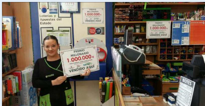
R. 05025 - Premio "El Millón" (17/02/17)