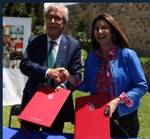
Llegan 2 millones de euros para los Juegos procedentes de Loterías y Apuestas del Estado.

La suerte también está en el nuevo resguardo azul