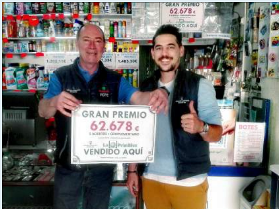
R. 05075 - 5 aciertos en la Primitiva (22/04/17)