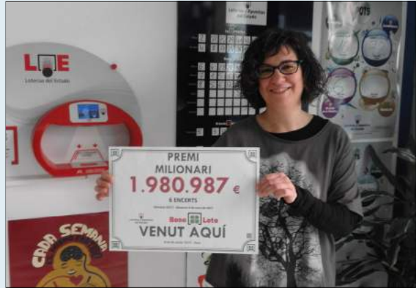
R. 75575 - 6 Aciertos en la Bonoloto (06/03/17)