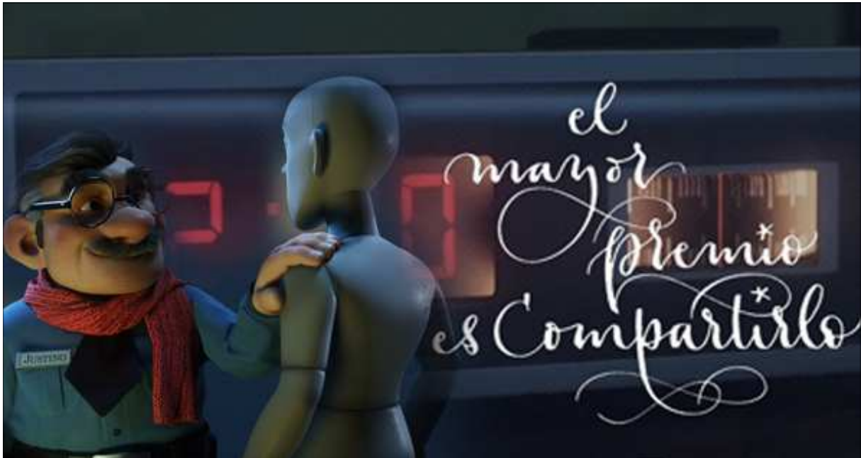
Imagen de la campaña publicitaria de la Lotería de Navidad 2015.

Algo más de siete millones de euros, en concreto 7,2 (IVA no incluido), es el presupuesto que Loterías y Apuestas del Estado ha sacado a concurso para sus servicios de publicidad navideña. La convocatoria se refiere a la estrategia, creatividad, producción, acciones de publicidad y comunicación para el Sorteo de Navidad y para el Sorteo de El Niño.