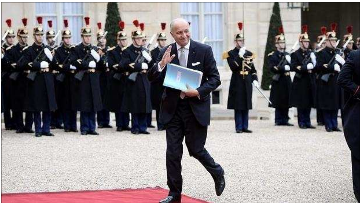
Laurent Fabius, ministro de Exteriores francés

Sobre Thomas Fabius pesa un mandato internacional de arresto emitido por las autoridades del Estado de Nevada