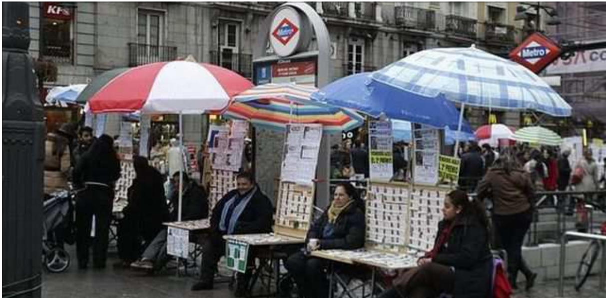
Vendedores ambulantes de Loterías en la Puerta del Sol, Madrid.

El concejal presidente del distrito Centro, Jorge García Castaño, ha asegurado que la presencia de venta ambulante ilegal en su distrito ha descendido, sobre todo en periodo de Navidad, y ha avanzado que se va a crear una regulación específica para la venta de Lotería en la Puerta del Sol en colaboración con Loterías y Apuestas del Estado y con la Policía.