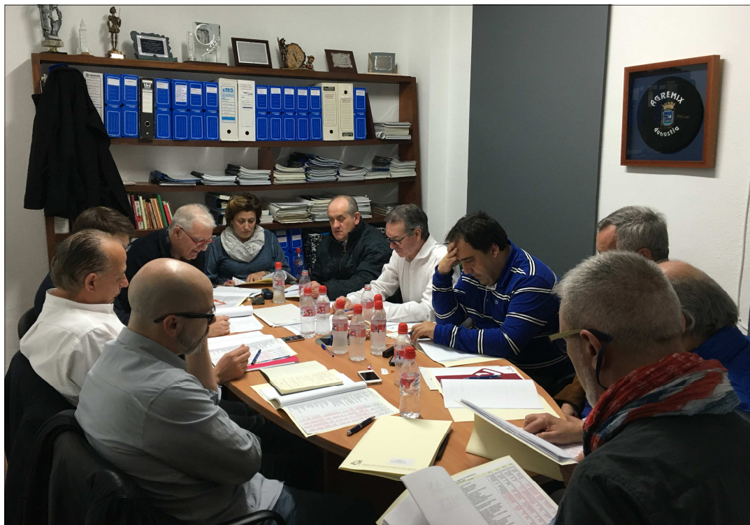
Imagen de la última sesión de Junta Directiva de FENAMIX, en la sede en Sevilla.

El pasado día 30 de Enero se llevó a cabo la celebración de la última sesión de Junta Directiva de FENAMIX, en la sede de la Federación en Sevilla.