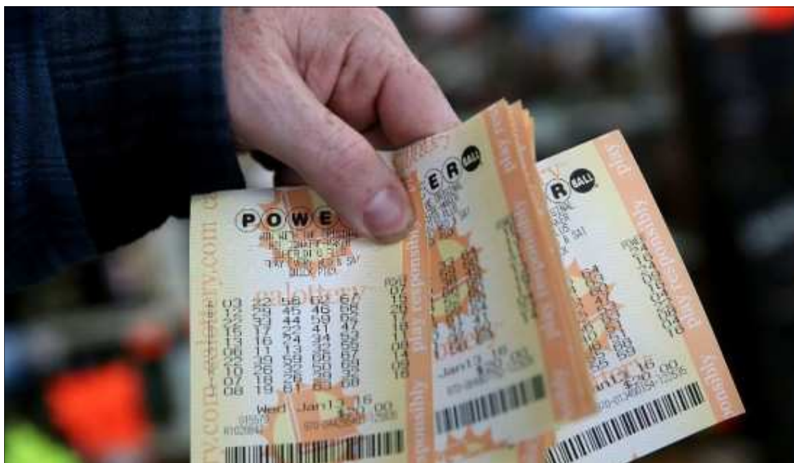
Imagen del boleto del sorteo de la Powerball.

Tanto Powerball como Mega Millions han disminuido en los últimos años las probabilidades de ganar sus botes para propiciar varios sorteos consecutivos, cuyas jugosas cifras atraen cada vez a más compradores y generan ventas multimillonarias.